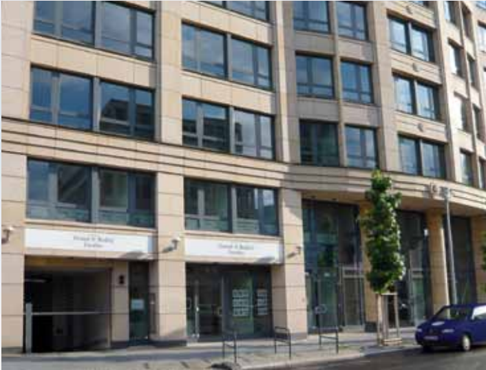
Büro Anlageimmobilien | Office Investment properties | Leipziger Platz, Mosse-Palais