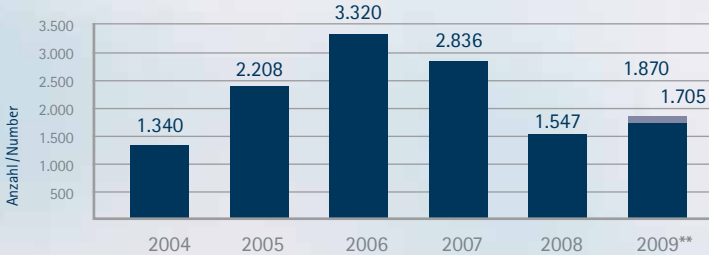
Verkaufte Wohn- und Geschäftshäuser* Residential and commercial properties sold*

* Mehrfamilienhäuser und Mischnutzung mit geringem gewerblichen Anteil * Multi-dwelling units and mixed use properties with minimal commercial use ** Prognose: / Forecast: Allgemeiner Grund & Boden Fundus