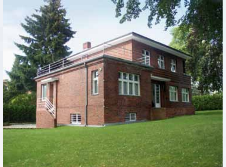
Büro Selbstgenutzte Immobilien | Office Owner-occupied properties | Zehlendorf-Mitte

Schon seit über 15 Jahren vermitteln wir Objekte der unterschiedlichsten Preiskategorien, von der Luxusvilla mit exklusiver Ausstattung bis zum Haus mit Modernisierungsbedarf. Unser inhabergeführtes Maklerunternehmen gehört heute zu den größten Berliner Immobilienanbietern.